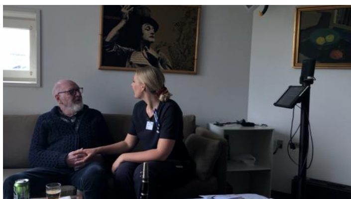
Billede fra Plejecentret Sølund, Københavns Kommune. Musikalsk samvær mellem beboer og medarbejder. De lytter sammen til musikstykke af Mozart.