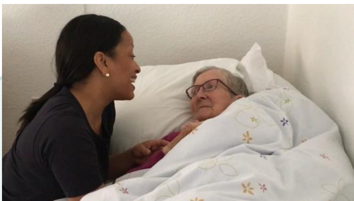
Billede fra Demenscenter Skovgården, Mariagerfjord Kommune med medarbejder, der synger for beboer, inden hun hjælpes op af sengen om morgenen.

Når sang og musik anvendes i sammenhæng med plejesituationer eller ved forskellige former for musikaktiviteter og